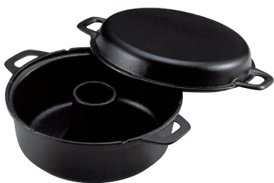
①南部 鉄イモノ パン焼器 ㊦