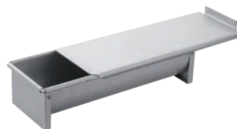
②プロベーカー 半円焼型 ㊦