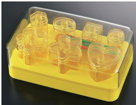
⑦ラ・カナッペメーカー保存容器付 No.2268 ㊦